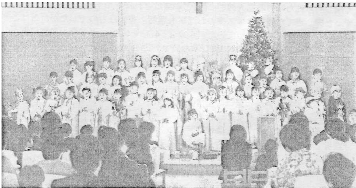
星の園幼稚園 クリスマス会 2006.12.15

新しい園舎になっても変わることなく、この園のお祈りのような心を子どもたちの中に育てていきたいと思います。