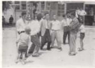
坂越キャンプ【昭和三十三年】