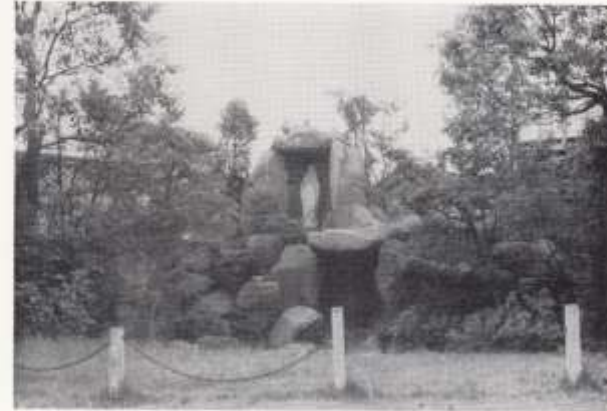
教会附属の星の園幼稚園