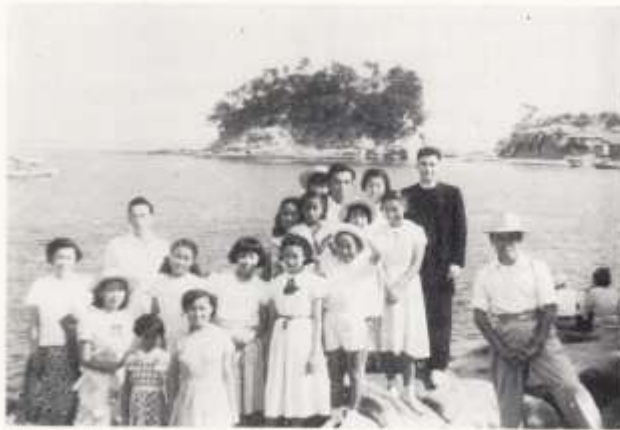
淡路島神社にて (昭和二十六年八月)