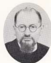
二代 ヲーラー神父