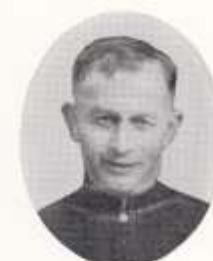
初代 ヲルシエ神父