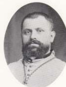
五代 故カスタニエ司教