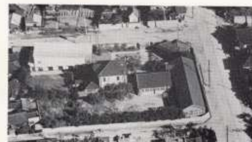
飛行機上より見た所