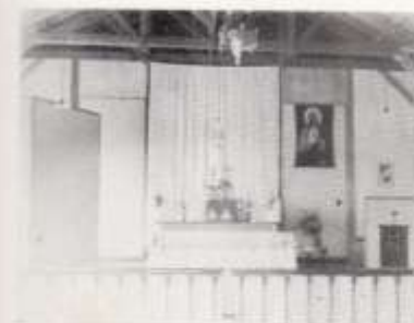
第 一 期