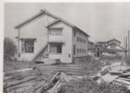
都市復興計画の爲め移転 改築後の仮聖堂