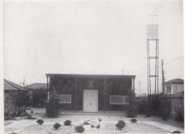
住吉カトリック教会の聖堂とその内部