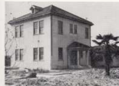
終戦直後の仮聖堂とその内部