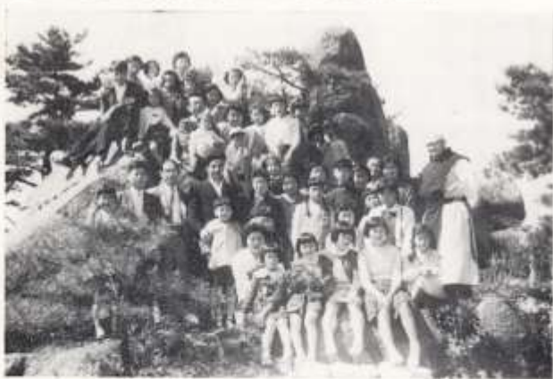
西宮トラスピスト修道院を訪問 (昭和三十二年秋)