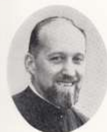
七代 ヲユゼン神父