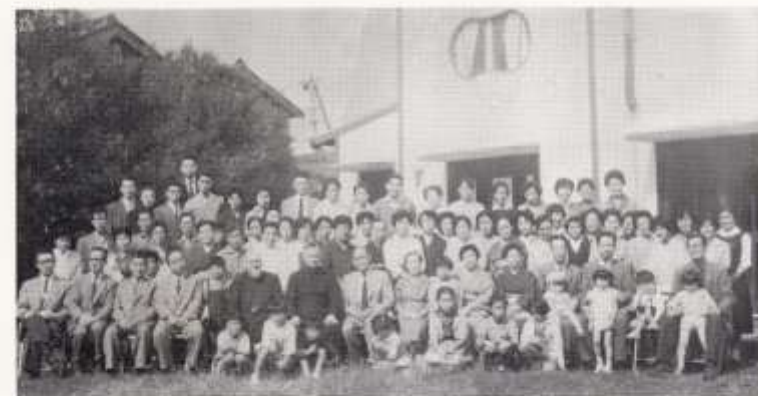
(昭和三十五年十月撮影)