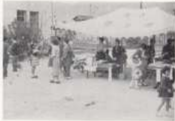
或る年のバザー風景