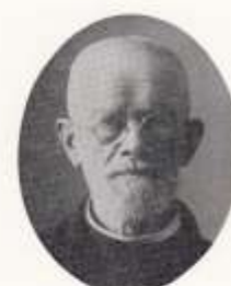
四代 故ビロース神父