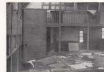
十三号台風にて破壊した仮聖堂の惨状