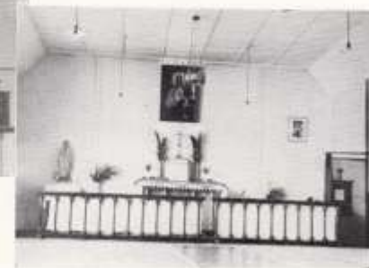
第 二 期